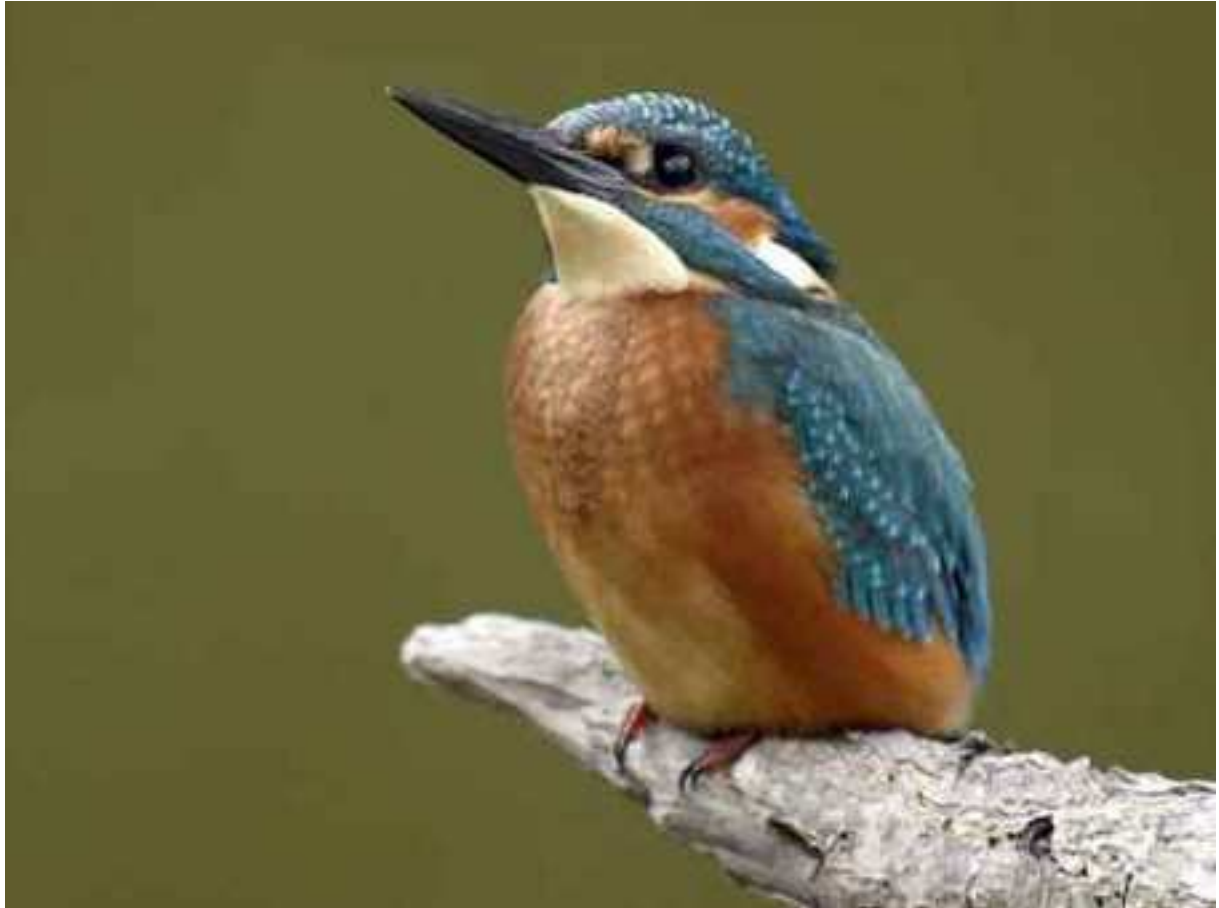
- Faisà ( Phasianus colchicus )