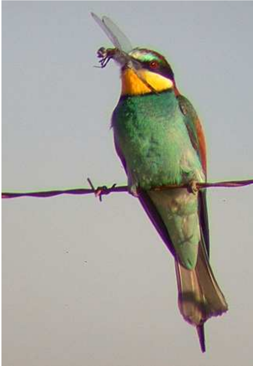
- Pinsà comú ( Fringilla coelebs ),