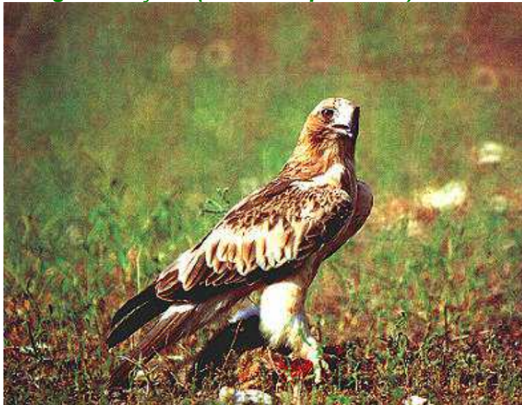
- Aligot ( Buteo buteo )