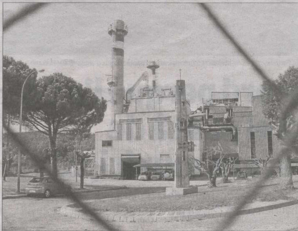
La incineradora de Campdorà, tal com és avui

L'Agència de Residus de Catalunya i l'Ajuntament de Girona haurien acordat, segons l'alcalde de la ciutat, excloure Campdorà com a ubicació del complex. Les dues institucions estarien d'acord